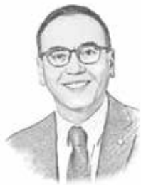
Franck GHERBI, Maire d'Hellemmes