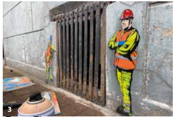
1. Fresque à l'entrée du plateau Jenner, réalisée par Frelon.

Mettre l'art au cœur de la cité, en allant chercher le regard des passants, ne rien imposer mais suggérer de lever la tête pour voir... c'est dans cet esprit qu'Hellemmes se transforme peu à peu en une sorte de galerie géante, offrant des dizaines d'œuvres - du mini pochoir au format monumental - à découvrir en se promenant dans les rues de la Commune.