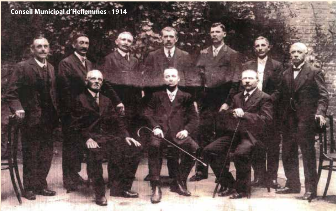
Conseil Municipal d'Hellemmes - 1914

Fort de son expérience de syndicaliste et de son envie de changement concret pour les ouvriers, il se présente aux élections municipales de 1912 à Hellemmes : il en sera maire jusqu'en 1925, ainsi que Conseiller général. Les premières résolutions prises sous son autorité sont de revendiquer la réintégration des cheminots « révoqués pour fait de grève » et l'amnistie pleine et entière en faveur des condamnés politiques et des emprisonnés pour les manifestations contre la vie chère.